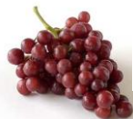
Ο τρύγος-το σταφύλι

Εβδομαδιαίος προγραμματισμός – 5 η εβδομάδα 3/10/2016 – 7/10/2016