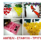
ΑΜΠΕΛΙ - ΣΤΑΦΥΛΙ - ΤΡΥΓΟΣ